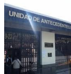
Unidad de Antecedentes penales del Organismo Judicial

LOS ANTECEDENTES PENALES TIENEN UN TIEMPO DE VIGENCIA DE 6 MESES.